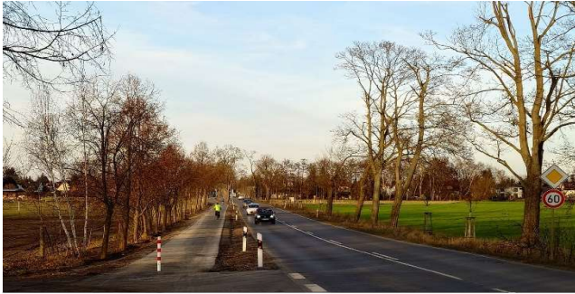
Nach Fertigstellung des „Radwegs“ – erste Radfahrer sind unterwegs, eigentlich wegen der fehlenden Beschilderung verkehrswidrig

Wie es jetzt aussieht, zeigen die folgenden Fotos.