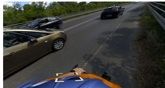
Auf dem 1,30m breiten Streifen wird es eng für Radfahrer – hier werden keine 2m Sicherheitsabstand durch die Kfz eingehalten

sehen - spätestens nachdem die MAZ am 14.11. zu dem Radweg über „Mehr Sicherheit für Radfahrer“ berichtete, dass die Radfahrer in Zukunft „absteigen und das Rad auf dem nur knapp 1,30 Meter breiten Randstreifen, der über die Brücke führt, schieben“ sollen.