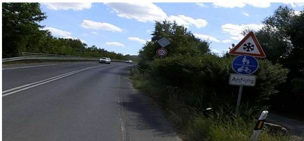
Brücke Potsdamer Str. - bisher benutzungspflichtiger Geh- / Radweg (nach geltender StVO nicht mehr zulässig!)

Die Situation nach Fertigstellung ohne den Umbau auf der Brücke hat man kommen