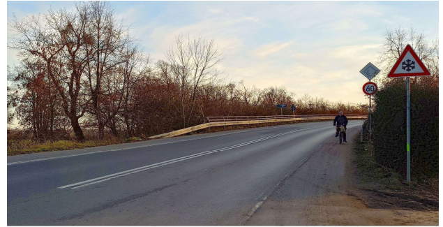
Gefährliche Nutzung über die Brücke in Gegenrichtung, ebenso verkehrswidrig – was passiert bei Gegenverkehr?

Aber wie konnte es dazu kommen? Lange Zeit wurde der Bau dieses Radwegs von der Straßenverkehrsbehörde genau wegen des fehlenden verkehrssicheren Umbaus der Brücke abgelehnt. In einer späteren Planung wurde dann ein 2,13m breiter Weg über die Brücke vorgesehen, was wohl schließlich zur Befürwortung beigetragen hat. Leider hat am Ende die Gemeinde Dallgow die benötigten Fördermittel für das Gesamtprojekt nicht erhalten und beschlossen, den Weg OHNE Umbau der Brücke selbst zu finanzieren. Wie eine Anfrage des ADFC Falkensee bei der Unteren Straßenverkehrsbehörde im November ergab, wird auch dort die Problematik erkannt. Man „behalte sich eine Beschilderung des Wegs vor“. Ob es überhaupt ein Radweg wird, wäre unklar.